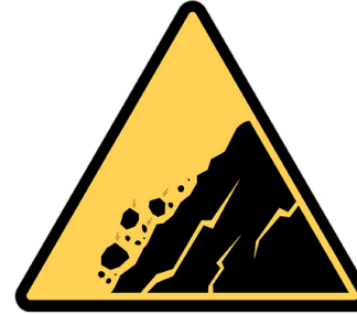
Rupture de talus