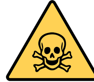
Exposition aux substances dangereuses