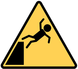
Chute de hauteur